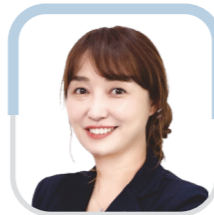
여 현 정 의원