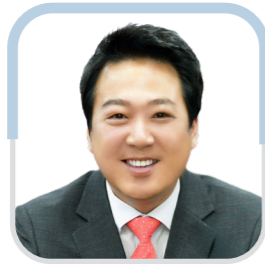
황 선 호 의장